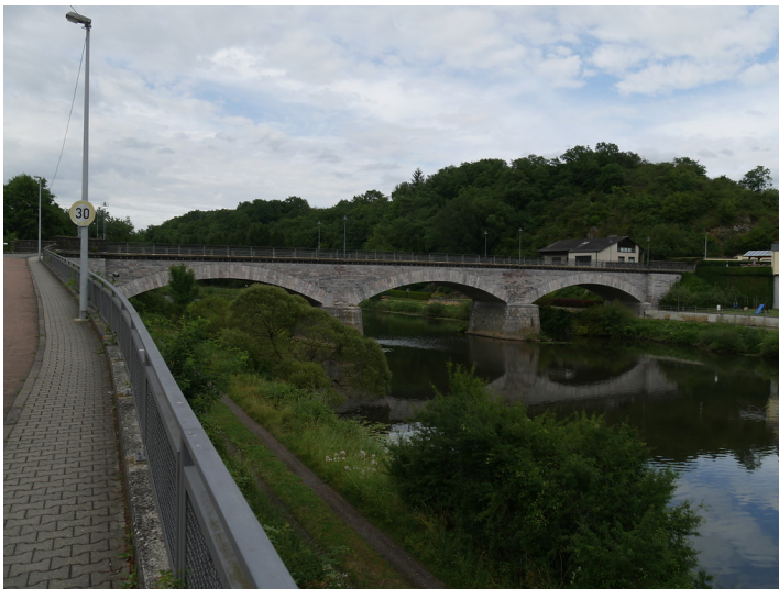
Südansicht der Marmorbrücke in Villmar (2017)