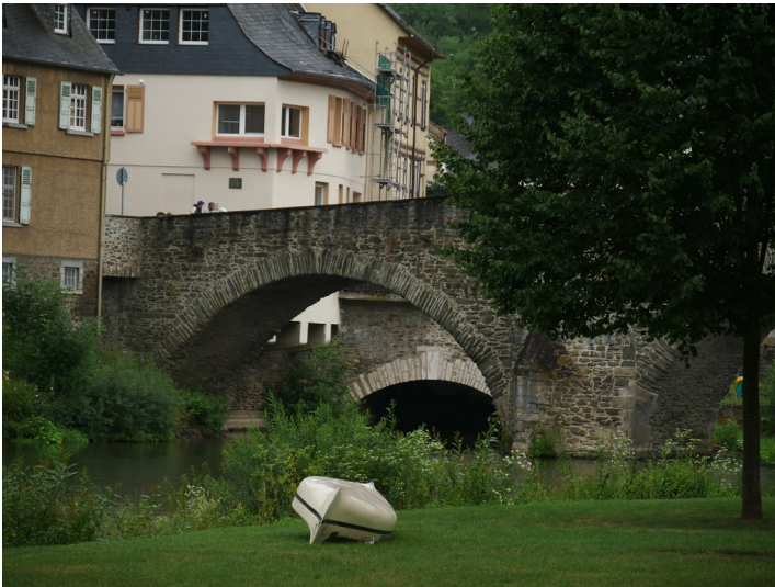
Schleuseninsel mit Straßenbrücke Runkel und der dahinter liegenden Stadtmühle (2017)