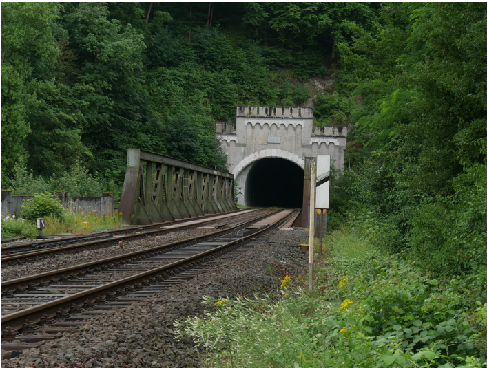
Eisenbahnbrücke bei Runkel mit östlichem Portal des Ennericher Eisenbahntunnels (2017)