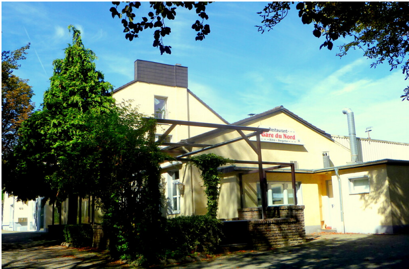
Das Empfangsgebäude des ehemaligen Nordbahnhofs Aachen, heute Gaststätte (2018).