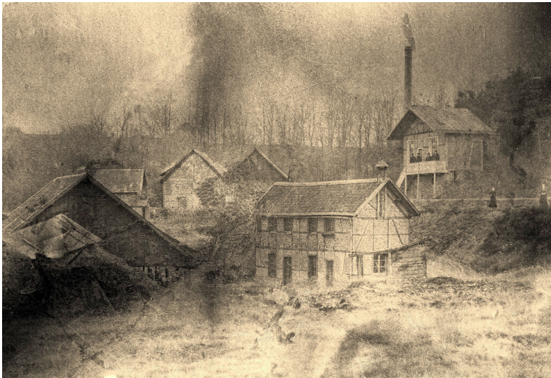
Die Betriebsgebäude der Grube Blücher um 1880. Es handelt sich um die einzige erhaltene Aufnahme aus der Betriebszeit. Das Original ist stark beschädigt.