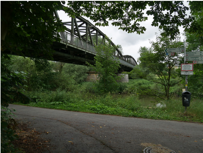
Ostansicht der Eisenbahnbrücke bei Limburg-Staffel (2017)