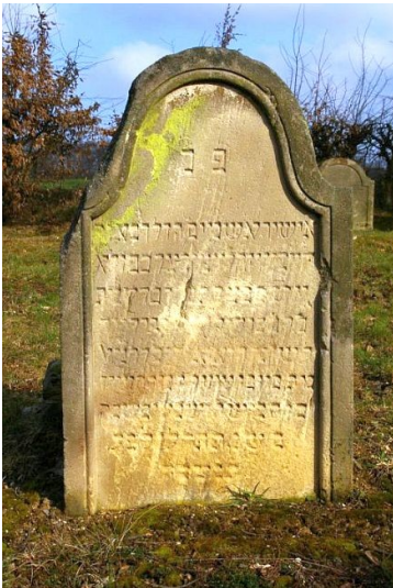
Einzelgrabstein auf dem jüdischen Friedhof Seesbach (2009).