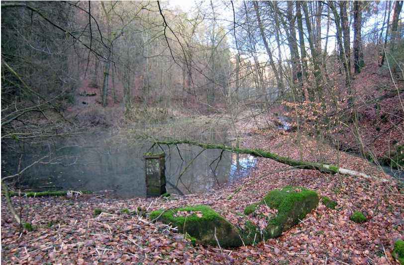
Der Kadettenweiher im Bergisch Gladbach-Bensberger Milchborntal (2013)