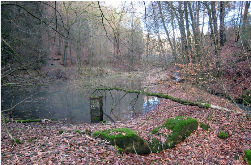
Der Kadettenweiher im Bergisch Gladbach-Bensberger Milchborntal (2013)