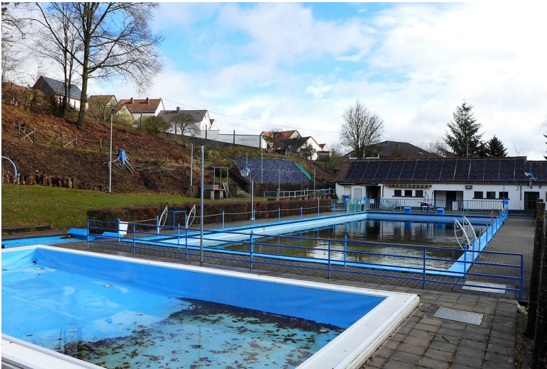
Soonwald-Schwimmbad in Seibersbach (2017)