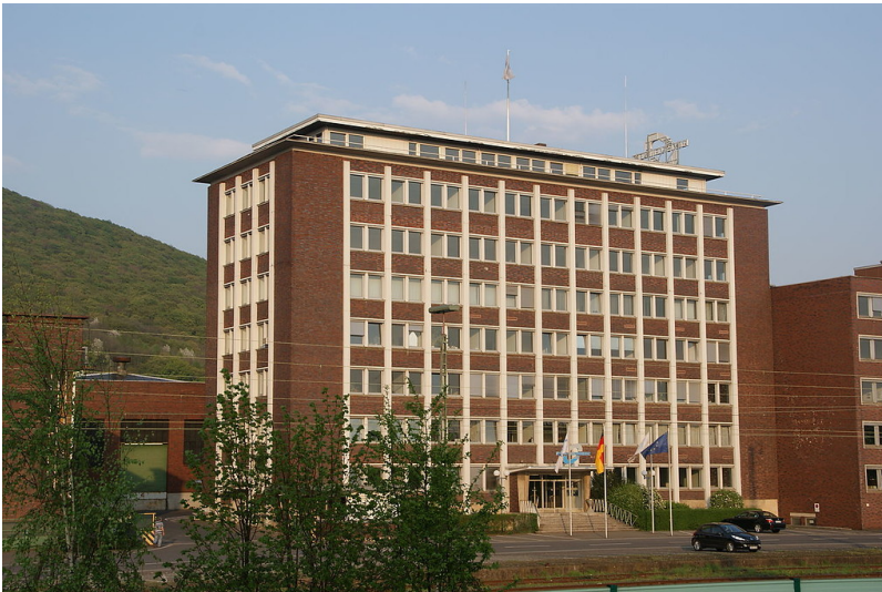
Das 1954/1955 erbaute Verwaltungsgebäude der Lemmerz-Werke in Königswinter (2009).