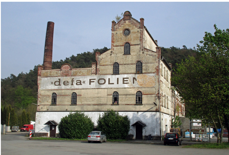
Hauptfassade des zentralen Gebäudes der Aggerhütte bei Lohmar-Honrath: früher Kupfererzhütte und Extraktionswerk Aggermühle, heute Gewerbegebiet (2017).