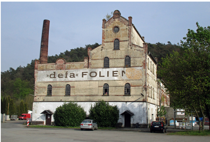
Hauptfassade des zentralen Gebäudes der Aggerhütte bei Lohmar-Honrath: früher Kupfererzhütte und Extraktionswerk Aggermühle, heute Gewerbegebiet (2017).