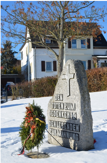
Kriegerdenkmal auf dem Friedhof Seibersbach (2017)