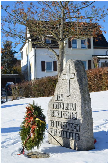
Kriegerdenkmal auf dem Friedhof Seibersbach (2017)