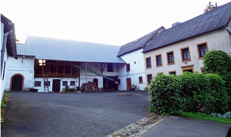
Die heute leerstehende Habscheider Mühle nordöstlich des Ortes Habscheid im Eifelkreis Bitburg-Prüm, eine denkmalgeschützte Dreiflügelanlage aus der Mitte des 19. Jahrhunderts.