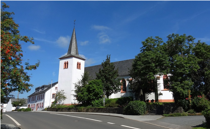
Die katholische Pfarrkirche St. Luzia in Habscheid im Eifelkreis Bitburg-Prüm, dahinter das Gemeindehaus.