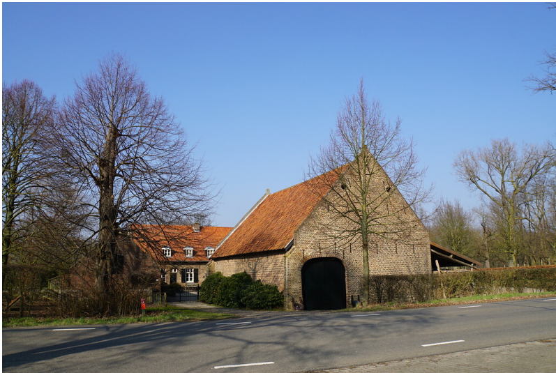
Schrevenhof bei Sint Joost (2018)