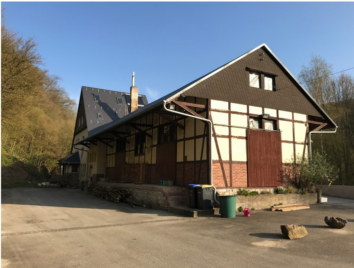
Rückseite des Bahnhofs "Stromberger Neuhütte" bei Seibersbach (2017)