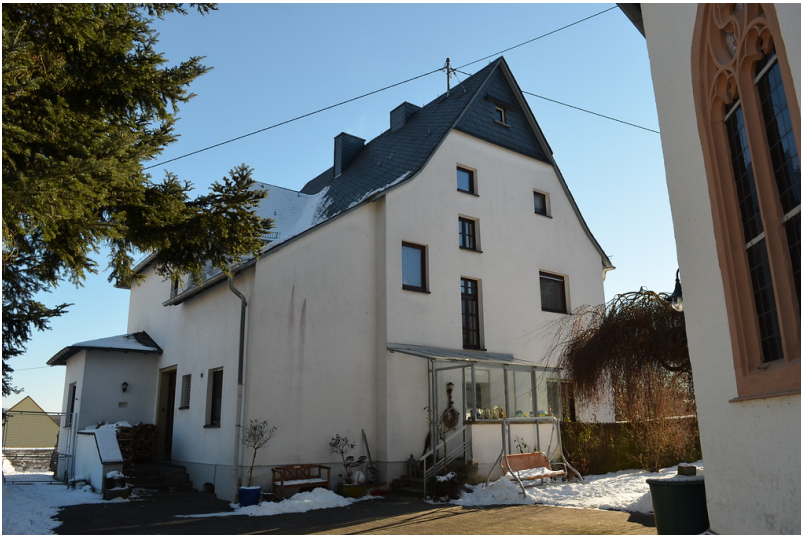
Neues evangelisches Pfarrhaus Seibersbach (2017)