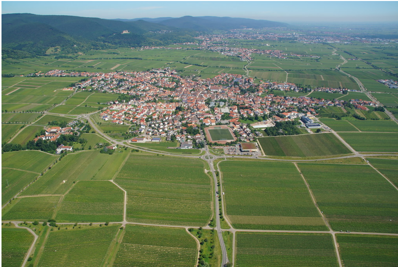
Luftbild: Blick auf Maikammer und Alsterweiler (2016).