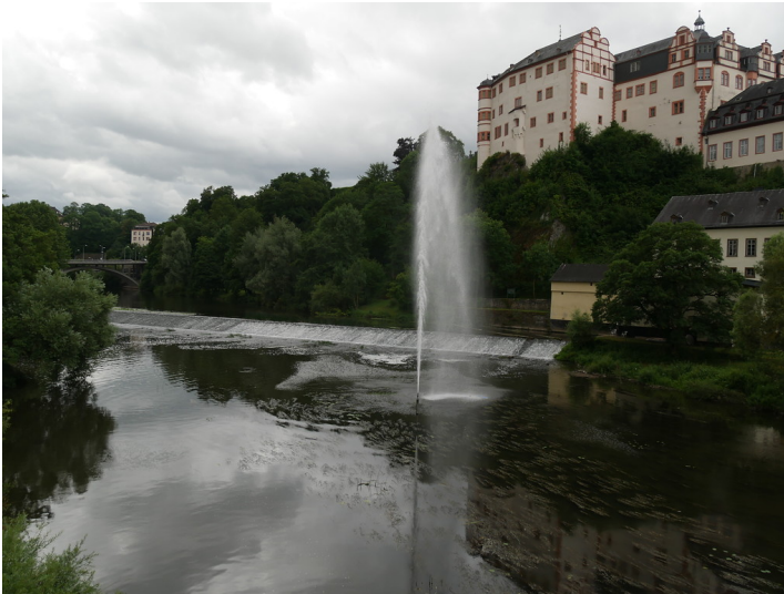
Brückenmühle und zugehöriges Wehr in Weilburg (2017)