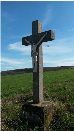
Wegkreuz in der Nähe des Aussiedlerhofs Daum bei Seibersbach (2017)