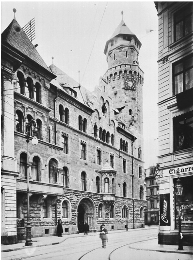
Historische Aufnahme aus der Kölner Schildergasse von 1912: Das 1907 erbaute und 1945 zerstörte Polizeipräsidium.