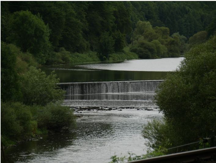
Wehre der Schleuse Förfurt bei Villmar (2017)