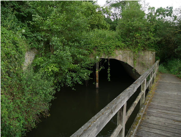
Oberer Mühlgraben der Dampf-Phosphor-Mahl-Mühle in Weinbach-Füfurt (2017)