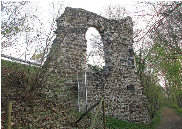
Die verbliebene Ruine des früheren Ulrather Hofes bei Siegburg (2017)