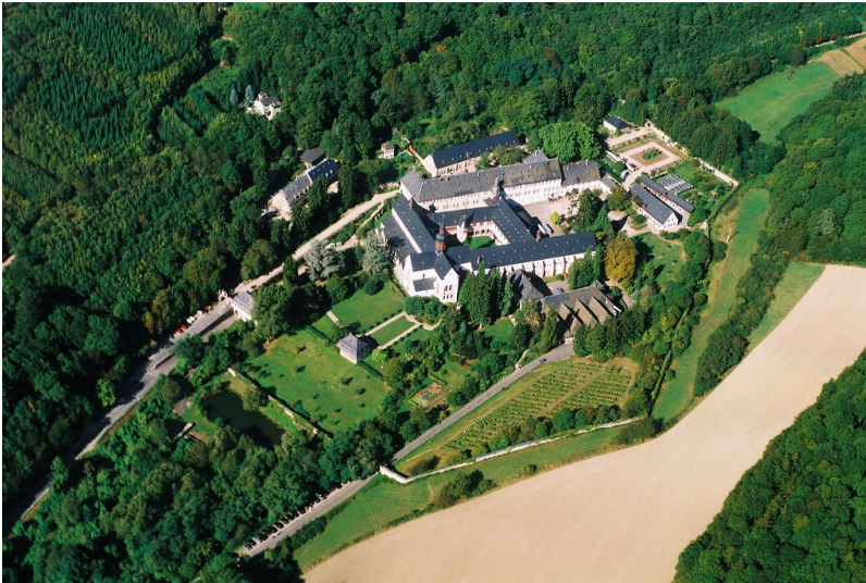
Blick aus der Vogelperspektive auf das Kloster Eberbach (2009).