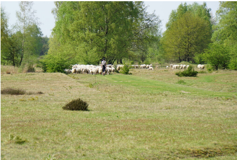
Schafherde in der Venloer Heide (2018)