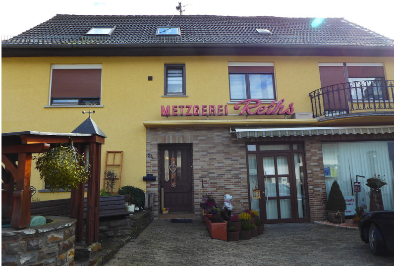
Frontansicht der Metzgerei Reths in Seibersbach (2017)