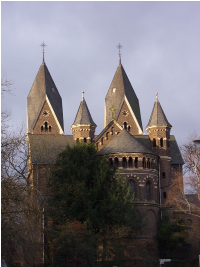
Die katholische Pfarrkirche Sankt Vitalis in Müngersdorf (2003).