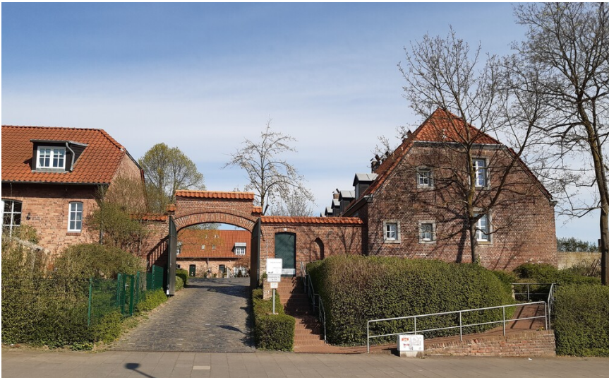
Der Arnoldshof im Kölner Stadtteil Bocklemünd/Mengenich (2025).