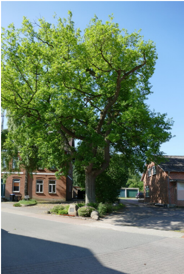
Kaisereiche mit Gedenkstein in Vogelsang-Grünholz (2018)