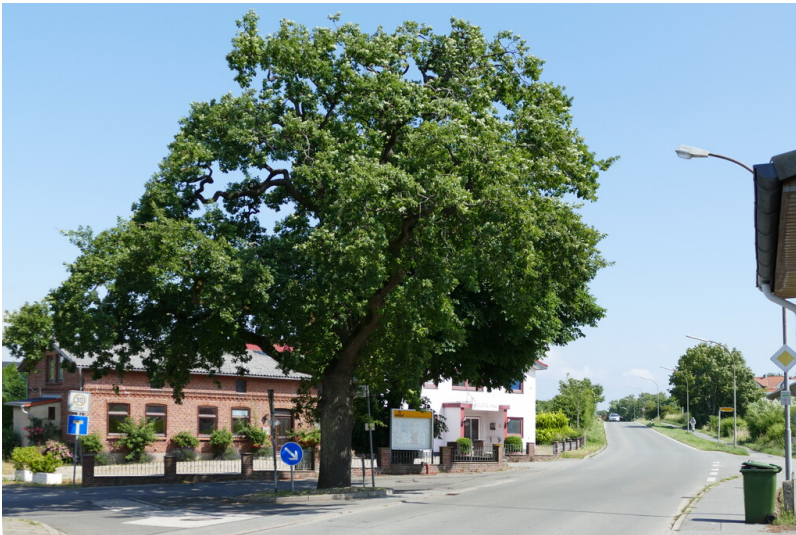
Gedenkeiche und Gedenkstein in Kopperby (2018)