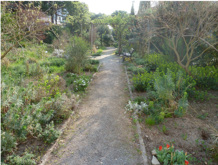
Mediterraner Garten Maikammer (2017).