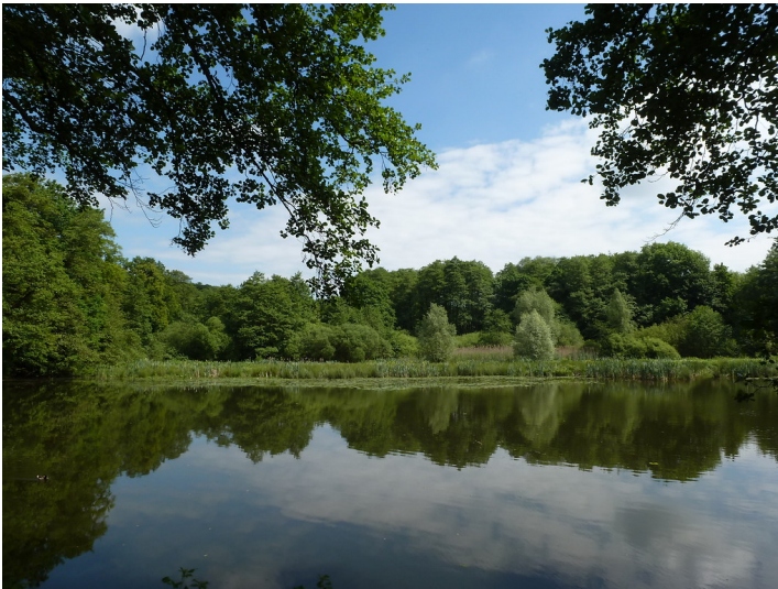
Aprather Mühlenteich (2017)