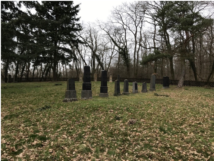
Jüdischer Friedhof Windesheim (2017)