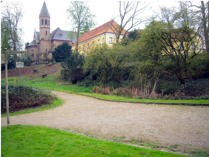
Vermuteter ehemaliger Standort der Mühle von Kloster Saarn (2016).