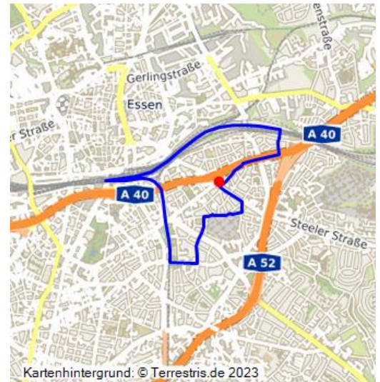
Kartenhintergrund: © Terrestris.de 2023

Das Südostviertel bildet zusammen mit dem Westviertel, dem Nordviertel, dem Ostviertel, dem Südviertel und dem Stadtkern die Stadtmitte von Essen. Es gehört heute als Stadtteil Nr. 06 zum Essener Stadtbezirk I.