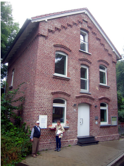
Voßgätters Mühle in Essen-Borbeck (2016), Front des Mühlengebäudes.