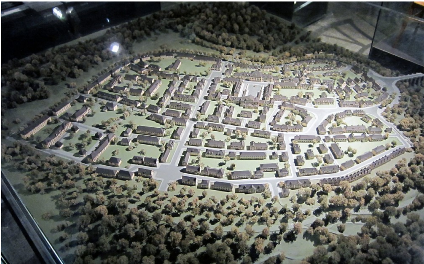
Gesamtansicht der Essener Krupp-Siedlung Margarethenhöhe in einem Modell (in der LVR-Verbundausstellung "1914 - Mitten in Europa", 2014).