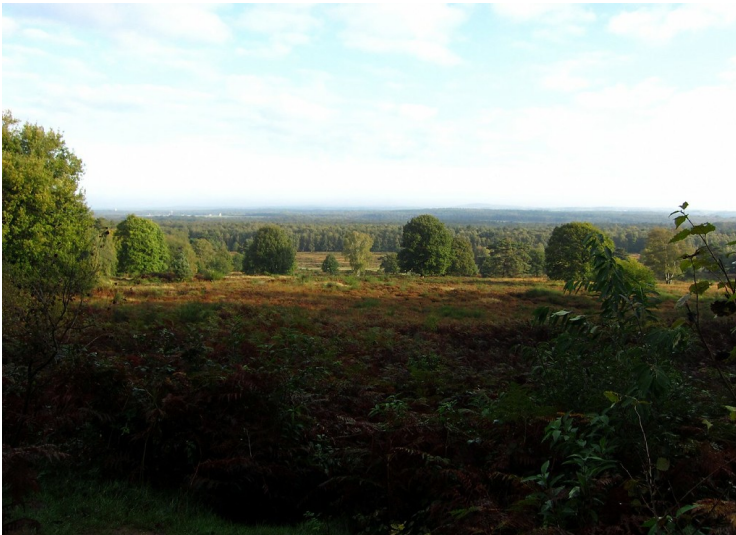
Blick über die jahrzehntelang militärisch geprägte Kulturlandschaft Wahner Heide (2011).