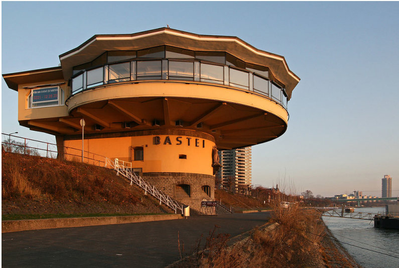
Blick auf die dem Rhein zugewandte Seite der Bastei am Kölner Konrad-Adenauer-Ufer (2008).