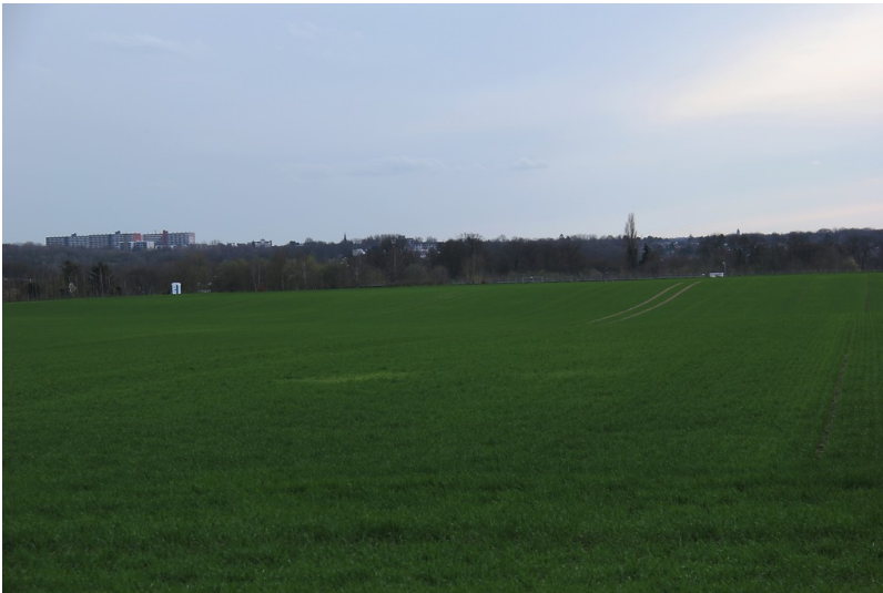
Ackerland nördlich von Merkstein (2017)