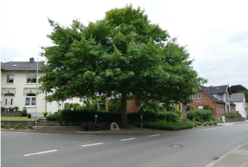
Kaisereiche mit Gedenkstein in Rieseby (2025)