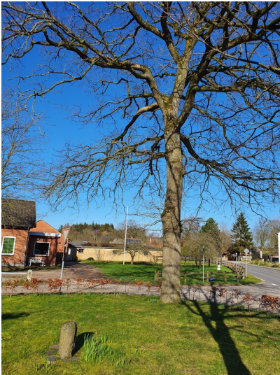
Kaisereiche mit Gedenkstein in Kosel (2020)