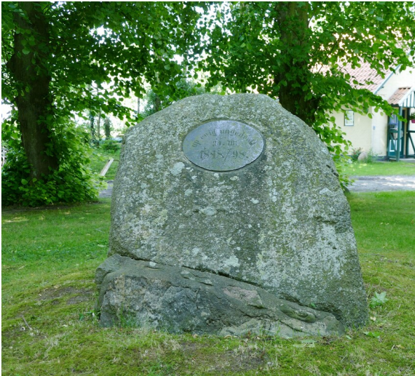
Gedenkstein von 1848 in Hegenholz (2018)