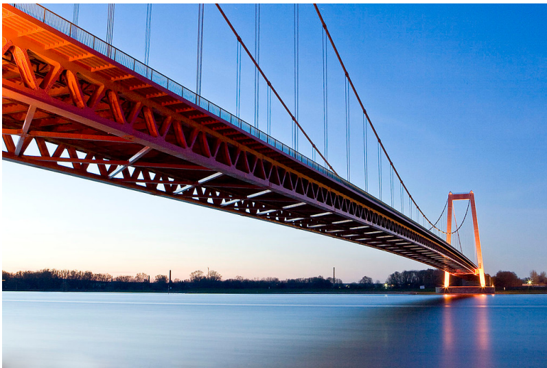
Ansicht der Rheinbrücke Emmerich (2009); das Bild lässt erkennen, warum das Bauwerk auch "Golden Gate Bridge vom Niederrhein" genannt wird.