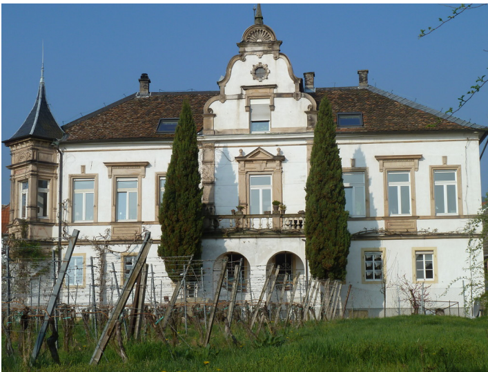
Die heutige "Kredenburg" in Maikammer-Alsterweiler (2017).