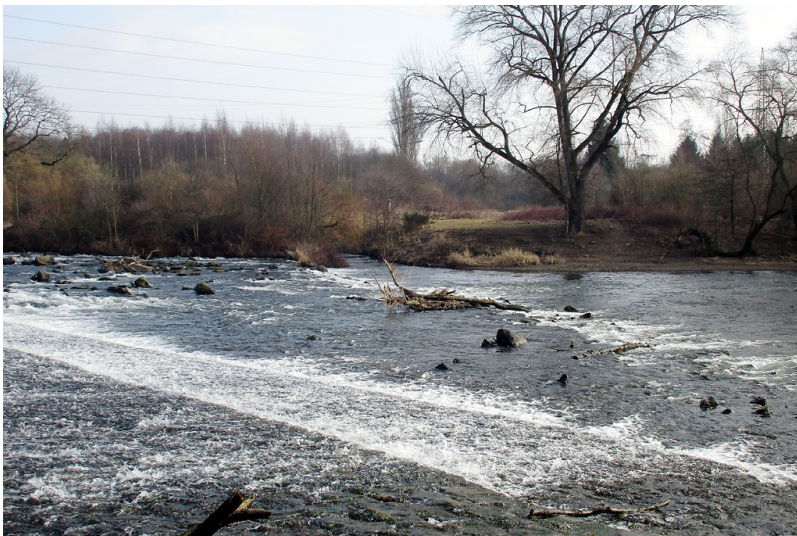
Stauwehr an der Agger bei Troisdorf, kurz vor der Mündung in die Sieg (2017). Hier zweigt der Troisdorfer Mühlengraben von der Agger ab.