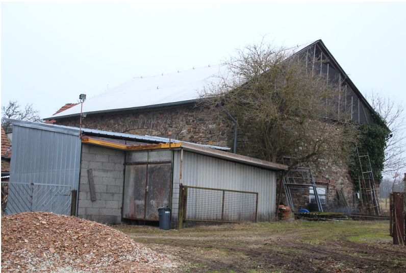
Gebäude der ehemaligen Ziegelhütte bei Seibersbach (2017)